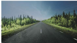
レイスタイルポラガンメタルグレー使用時