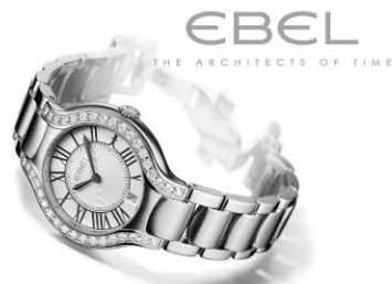
価格は18万円(税抜き)よりございます。 画像はペルガ52万円(税抜き)。

ヨーロッパのエスプリの薫り高い時計ブランド、エベル。創業は1911年で、婦人用のジュエリーウォッチから男性用の風格ある実用時計まで、素晴らしい作品を作り上げております。現在ブランドの大きな中心モデルは「ペルガ」、「1911クロノグラフ」。それから、ゴルフなどの大きなスポーツイベントのスポンサーとしてその知名度を広げていきました。