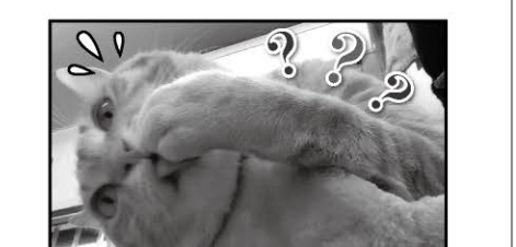
早く直さなきゃ!電気系統?