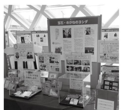
北九州イノベーションギャラリー 住 所…北九州市八幡東区東田2-2-11 TEL…093-663-5411

北九州イノベーションギャラリーにヨシダの展示コーナーが出来ました。 北九州イノベーションギャラリーでは3月22日まで「世界一展」というタイトルで北九州市が誇る世界一の技術が展示されており、併設されている北九州オンリーワン企業展の中の一つとしてヨシダのコーナーも出来ています。前回の北九州オンリーワン企業大賞に選ばれたおかげですが、主に宝石のリフォームとめがねの陣カットなど特殊技術をアピールしています。