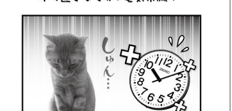
違った!機械のようぞ... 15年もたったからなま