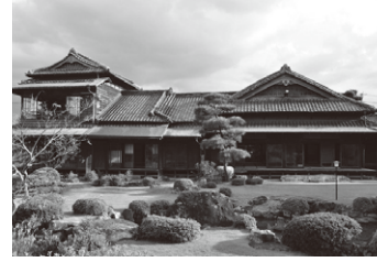
旧伊藤伝右衛門邸