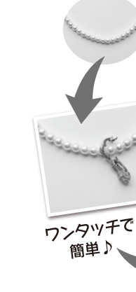
ワンタッチで簡単!

色々なシーンに合わせてアレンジが楽しめます。値段は25000円から78000円まで。