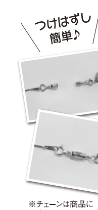
※チェーンは商品に含まれません。

18金製とホワイトゴールド製があった共に25000円。ぜひ一度、店頭でお試し下さい。