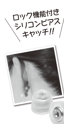
ロック機能付きシリコンピアスキヤッチ!!

「高額なピアスを買ったけれど片方落としてしまった...」昔買ったピアスの金具が甘くなつてしまった...このような声にお答えして新しいピアス金具「落ちない君」を新発売。価格もペア1980円。