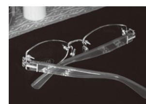
東京発手作りめがねハンド