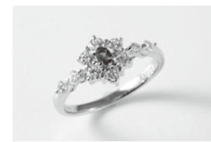
今回は希少宝石とイタリアンネックレスを揃えました。

ヨシダ本店 とき 2月14日(金)~18日(火) ヨシダがおすすめる宝石、めがねの逸品をこの機会に特別価格にてご提供いたします。どうぞ、消費税増税前のこの時期に良い品をお求め下さいませ。