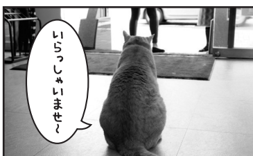
お客様をお出迎えしたり…