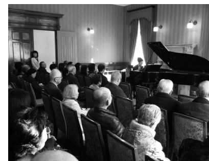
前回の補聴器コンサートの様子

当日は、ヨシダスタッフはじめ、補聴器メーカーさんにも応援頂きお求め頂いた補聴器のメンテナンスをさせて頂いた