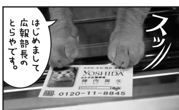
名刺交換もします…