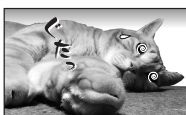
猫の手も借りた忙しいさでやす(涙)