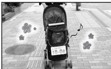
朝、専用カートでご出勤♪