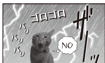
ヒェ～! こっちのピハピハはキライ!!