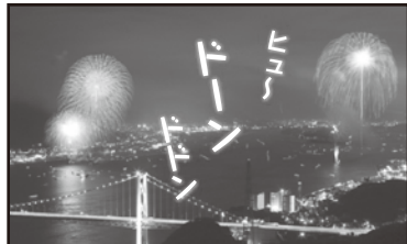
今日は花火大会ですよ。