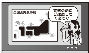
ちょっと天気心配だニャー