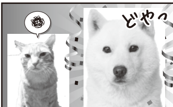
だって、ぼくじゅなくてワソコが受賞したから…