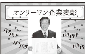
オンリーワン企業大賞受賞!!