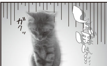
だって、ぼくじゅなくてワソコが受賞したから…