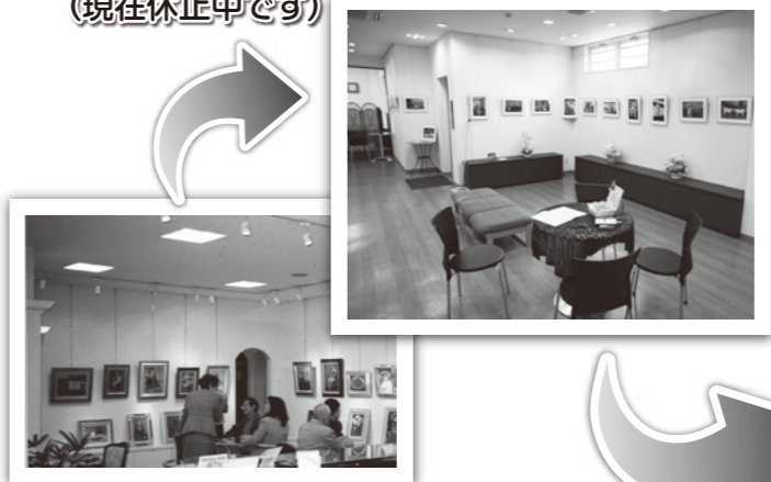
旧・本店ギャラリー