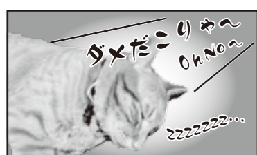
なんか眠たくなってきたでヤス...