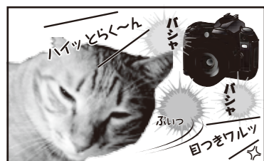
あっしも写真展をするでヤスか?