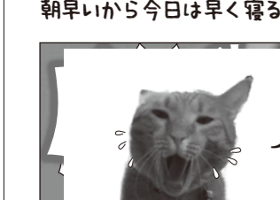
寝過ごしたでやすうらう