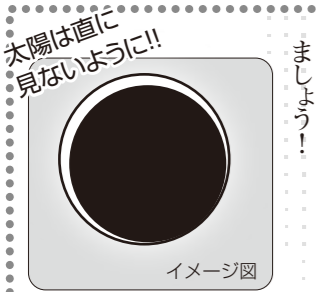
福岡では午前7時26分くらいが見ごろのピークです。

「金環日食」は非常に珍しい天文現象で日本で今回、見られるのは実に25年ぶりになります。 ただ今回のように、全国的に観測できるのはめったにあることではないそうです。 と言つことは、身近で金環日食が見れるのは「一生に一度あるかないか」の幸運な日☆ 世紀の天文ショーを楽しみましょう!