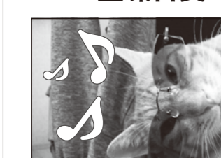
明日はキンカンニッショク〜ト