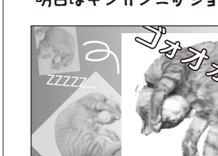
朝早いから今日は早く寝るでヤス。