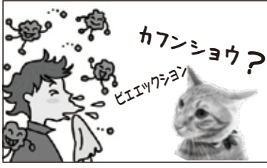
カフンショウ? ってなんでヤスか??