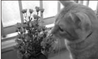
ネコは花粉でくしゃみはしないでヤス。