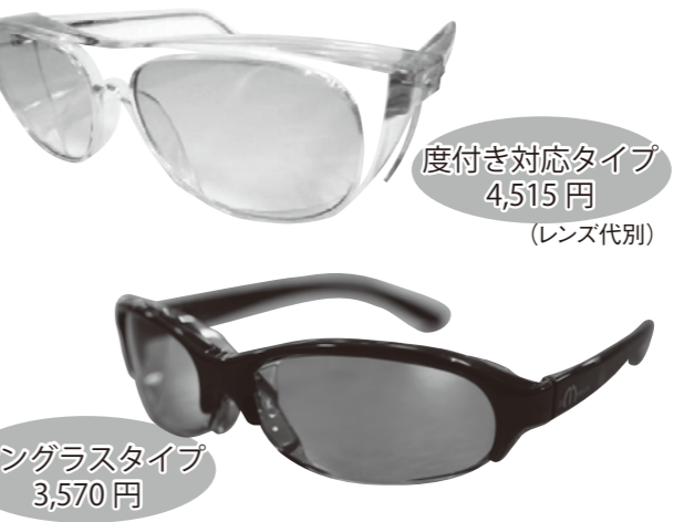
度付き対応タイプ 4,515円 (レンズ代別)

以前、このとらや通信で連載していた「腰痛体験記」で紹介したように、腰痛で悩んでいた時に飯塚の針の病院に行った事がございます。余りの患者さんの多さに驚き、どうしてかとお聞きしましたら、春先は8割が花粉症の患者さんで「鼻に直接針を打って治されるから」とお聞きして驚いた事がございます。やはり、そこでも個人差の大小があると言われていました。