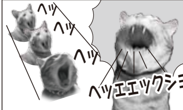
ボクもカフンショウ?!