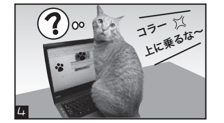
どうやって中に入るんやしょ???