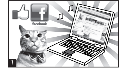
(管理人) フェイスブック始めました♪