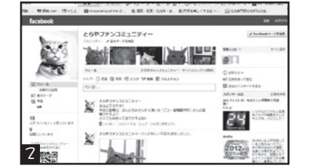
とらやファンコミュニティーでつづやっています。