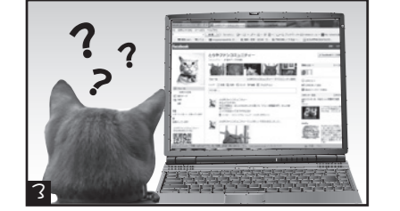
あっしがパソコンのなかに?!