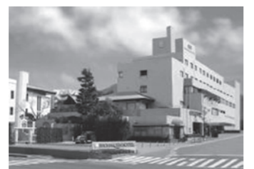
会場:松柏園ホテル

他にも楽しい景品が当たるゲーム、そしてなによりも宝石時計めがね、アパレルの商品が約10,000点展示してある中からお気に入りのひと品を見つけたら、この展示会の醍醐味です。ただ今、チケットを各店頭にて好評発売中です。ぜひお友達とお誘い合わせの上、ご来場を心よりお待ちしております。