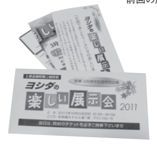
今回の展示会のチケット

このヨシダ主催の展示会は1,000円の特設チケット制で、ご来場の際には、約2,000円相当の景品をご用意しております。そしてお買上の際には、その金額に応じてお買上賞が特典としてございます。また、会場内では3時以降にこ