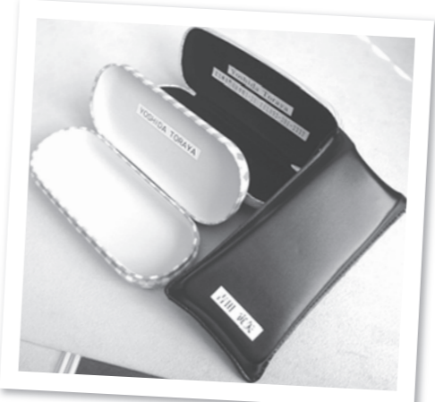
見本をご用意しております。どうぞご遠慮なくお申し付けください。

「氏名」「イニシャル」「電話番号」「住所」などご希望に応じて入れさせていただきます。どうぞご遠慮なくお申し付け下さい。ヨシダはこれからもサービスの種類を広げさせて頂きたいと考えております。