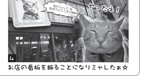
お店の看板を飾ることにミヤしたあ☆