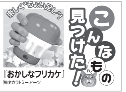
「おかしなフリカケ」 株式会社ミニアーツ

「おかしなフリカケ」はスナック菓子やビスケット、おせんべいなどの菓子を砕いてふりかけにできる商品。容器にお菓子を入れ、キャップを閉めて回すと、すり鉢のようなプラスチックの歯が菓子を細かく砕いていく仕組み。砕かれたお菓子は本体下部のふりかけ口からご飯などに振り掛けることができ、好みの細かさに対応できるよう、「粗」「中」「極（ラーメンスナック専用）」の3種類の歯が用意されています。