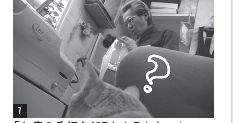
「お店の看板をどうしようかな…」