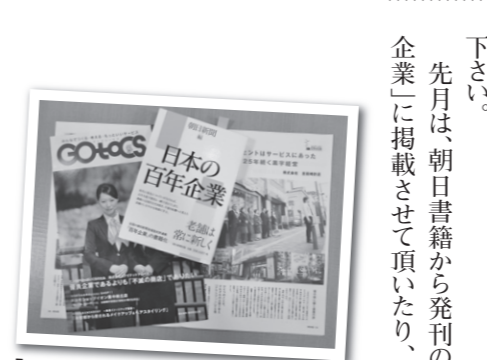
「百年企業」とドコモ掲載ページ