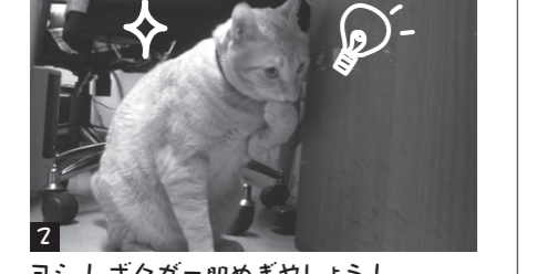
ヨシ！ ボクがー眼めぎやしよう！