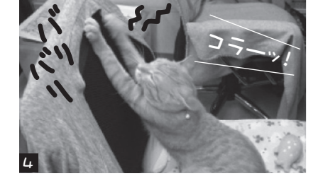
4 同じ「かく」でモボクはツメをかく