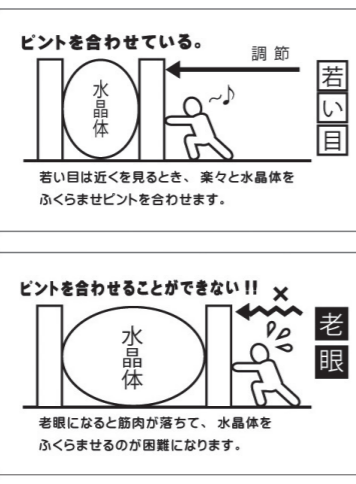
ヨシダ門司港店 鮎川 浩一

人間の眼は近くを見る時、眼球の形を膨らませて近くピントが合うような仕組みを無意識に行なっているのですが、残念な事にこの「ピントを合わせる仕組み」が年齢とともに徐々に衰え始めてくるのです。「えっ?!そんなに早い年齢で老