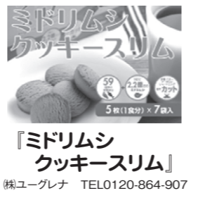
『ミドリムシ クッキースリム』 株式会社ユーグレナ TEL0120-864-907