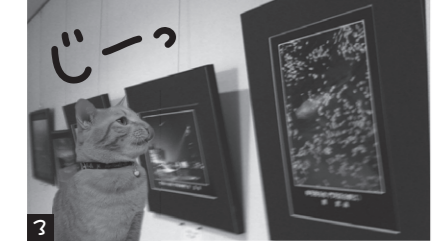
3 自分もニャニャが描けるガニャ?