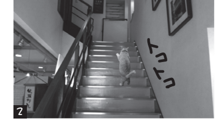
2 ステキな作品がいっぱいあるニャ...