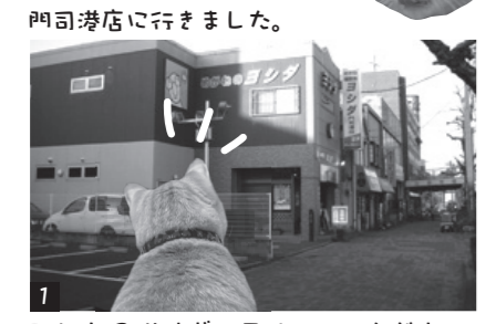
1 アレ! 2階はギャラリーニャンだ!